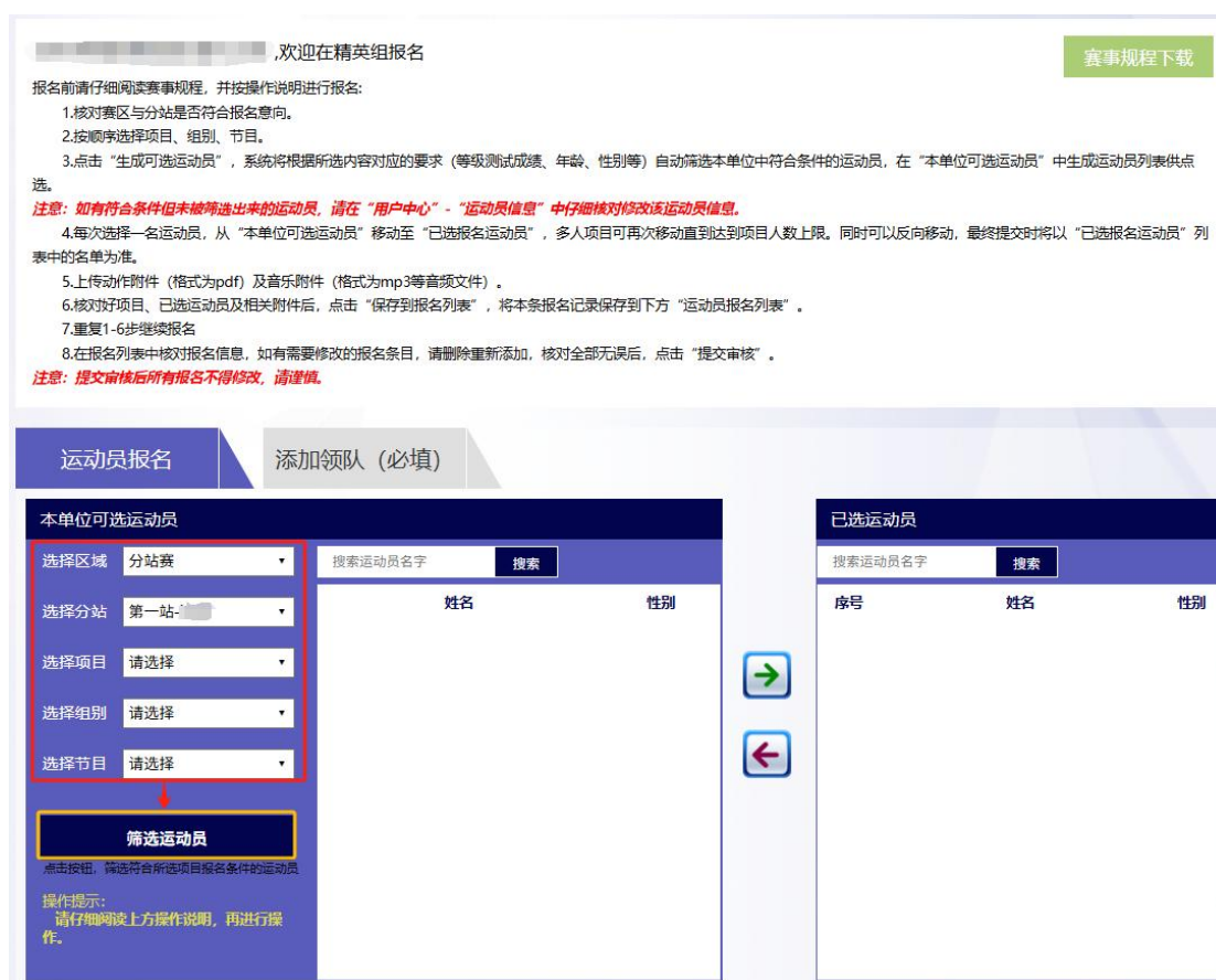
图 7 显示符合报名条件的运动员

点击要报名的运动员，点击向右箭头，该运动员将进入已选运动员栏；如需调整，点击右侧已选栏中的运动员，点击向左按钮将其移出已选列表。确认报名人员后点击“保存到报名列表”，成功则显示“保存成功”，可在下方“运动员报名列表”查看报名信息并进行下一步。