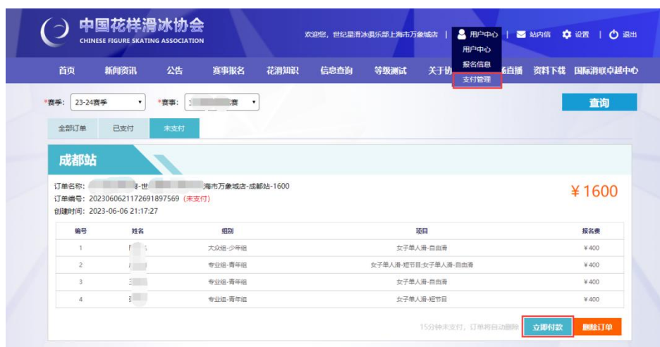
图 19 重新支付