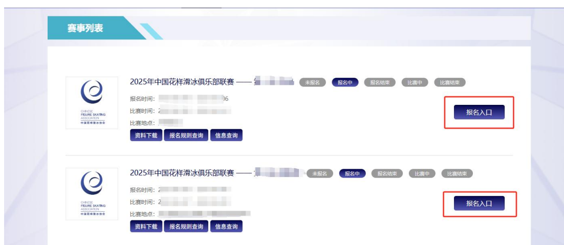
图 4 选择赛事，点击“报名入口”

可使用赛事对应的[资料下载]、[报名规则查询]、[信息查询]下载比赛规程、成绩册、秩序册、时间表、出场顺序等文件，并了解报名不同项目和组别的年龄及等级测试要求限制，或查询下载比赛后单个节目小分表。