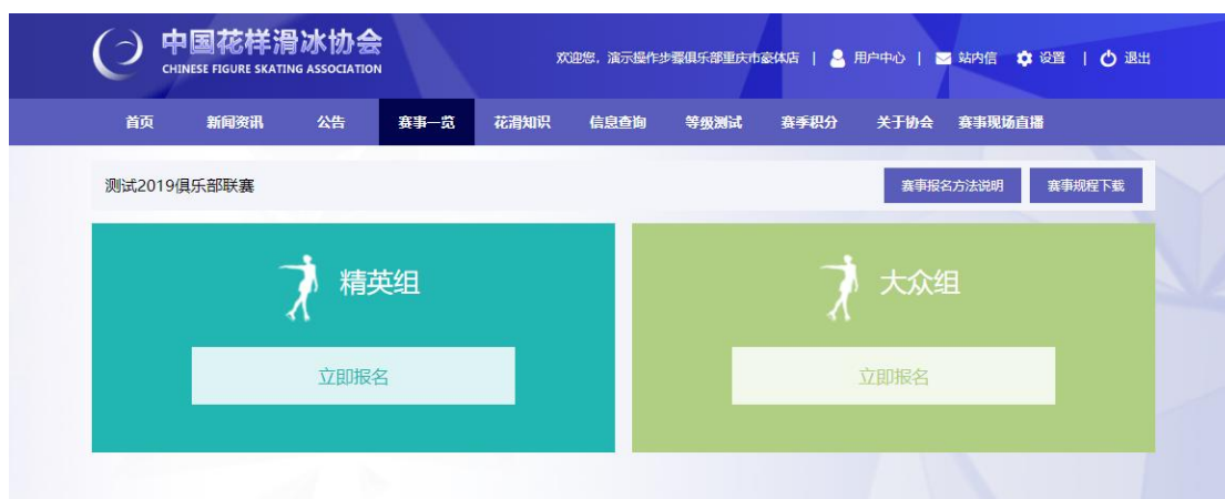
图 5 选择报名的组类