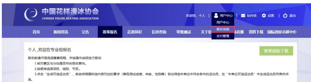
图 16 进入缴费