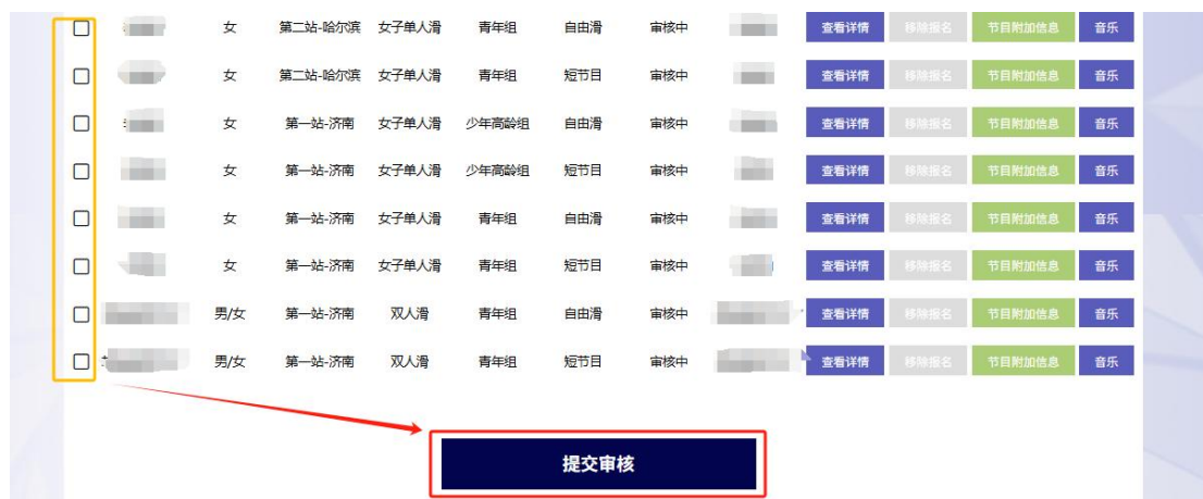
图 14 勾选并提交审核

在报名列表中， 左侧复选方框勾选要提交审核的运动员 ，点击【提交审核】。未填报“节目附加信息”和“音乐”的无法成功提交审核，请仔细核对报名信息完整准确后再提交审核，否则可能导致驳回后再次提交影响报名进度。