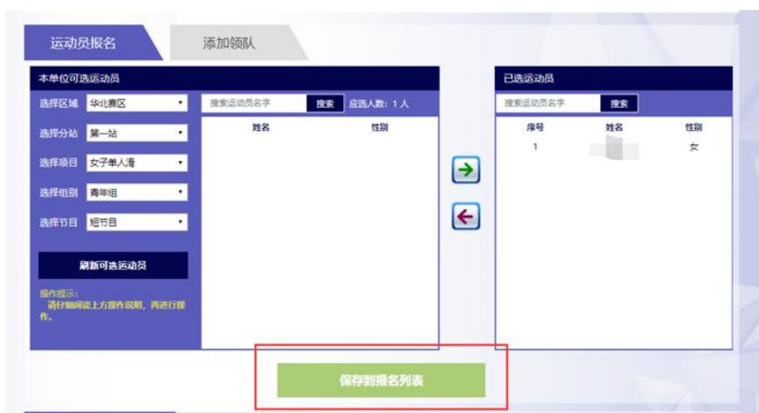
图 9 点击“保存到报名列表”