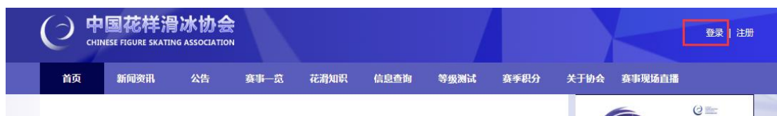
图1 点击“登录”（红框所示位置）