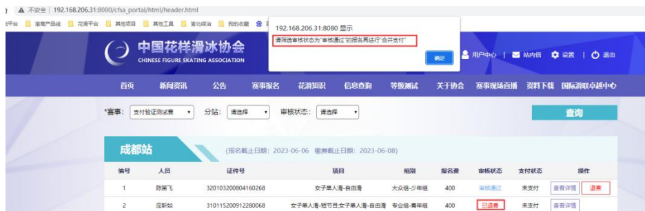
图 18 不可含有非“审核通过”的人员

符合支付要求时，系统将生成支付宝二维码支付页面，请打开支付宝 APP 扫码完成支付。