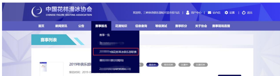
图 3 导航栏进入赛事报名