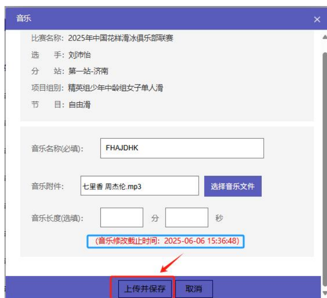
图 13 音乐修改截止时间

首次上传完音乐后，在音乐修改截止时间内，可重新更改音乐名称并选择音乐上传以此变更原音乐文件。