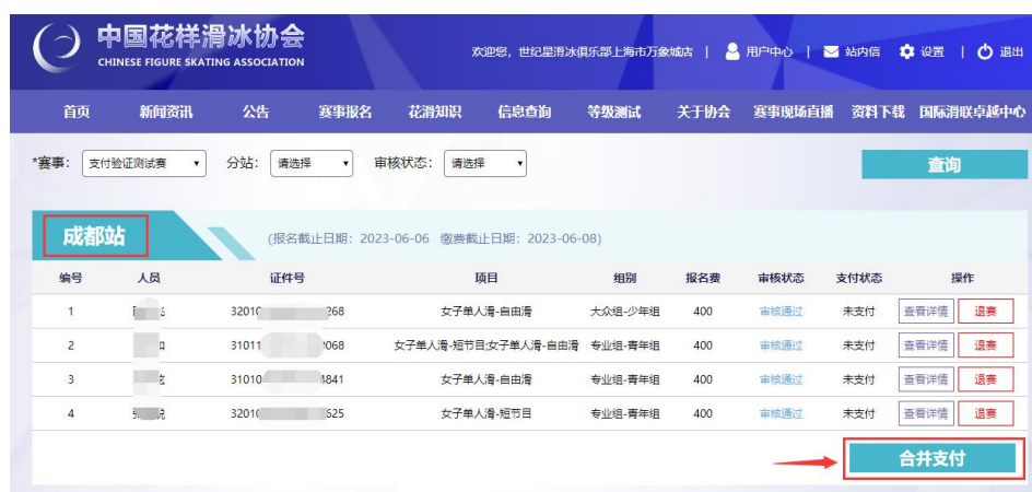
图 17 发起支付

如未进行筛选且列表中含有“审核未通过”、“审核中”、“已退赛”状态的人员，系统将弹出错误提示。