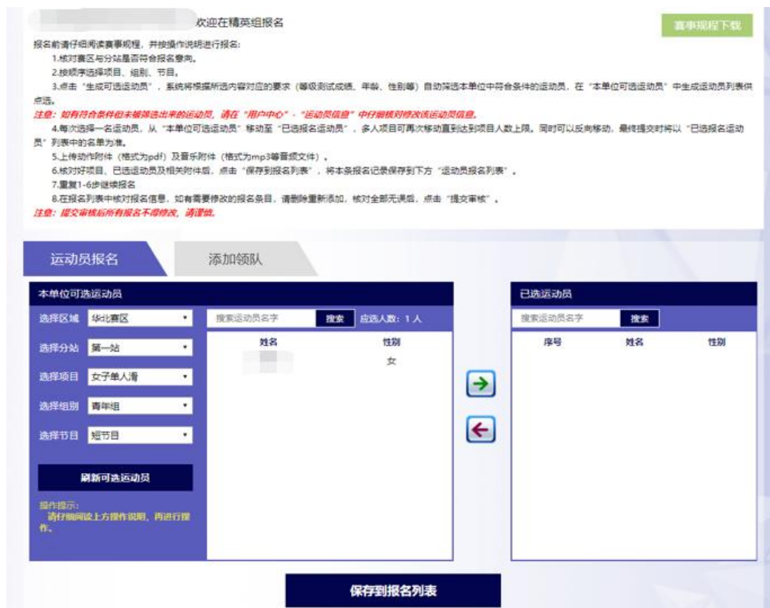
图 6 显示符合报名条件的运动员

点击要报名的运动员，点击向右箭头，该运动员将进入已选运动员栏；如需调整，点击右侧已选栏中的运动员，点击向左按钮将其移出已选列表。确认报名人员后点击“保存到报名表”。