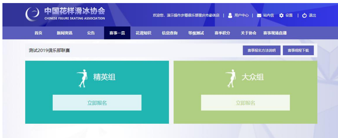
图 5 选择报名的组类

选择要报名的组类（精英组/大众组），点击“立即报名”。切换不同组类报名时，请在此页进入。