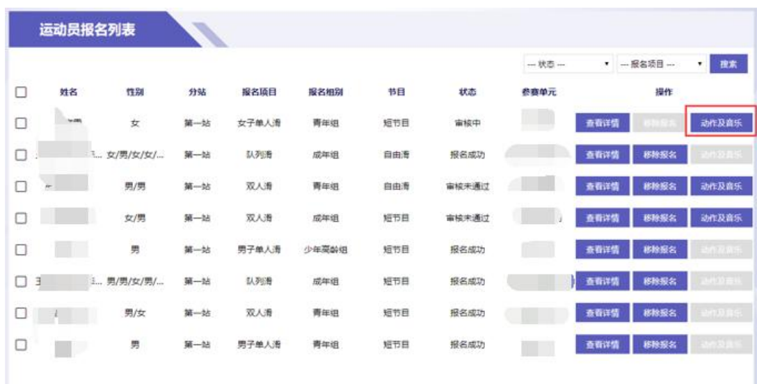
图 9 补充动作及音乐

完成各组别和各级别运动员的报名保存后，在运动员报名列表中，点击运动员对应的“动作及音乐”，为已保存的运动员补充相关信息及音乐附件。