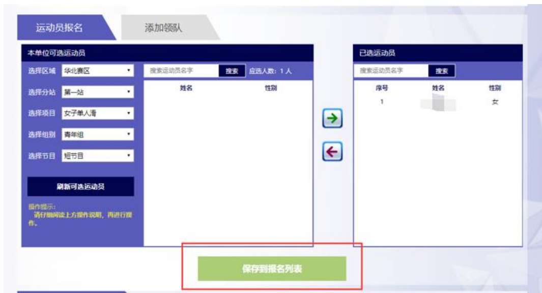
图 8 点击“保存到报名列表”