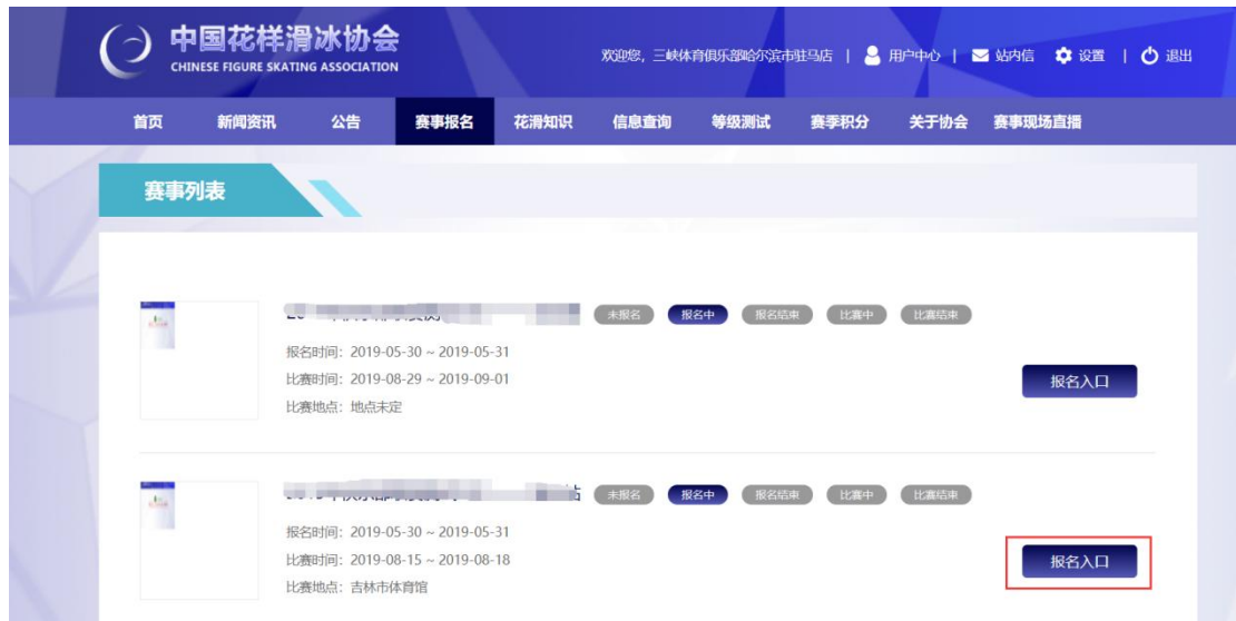
图 4 选择赛事，点击“报名入口”