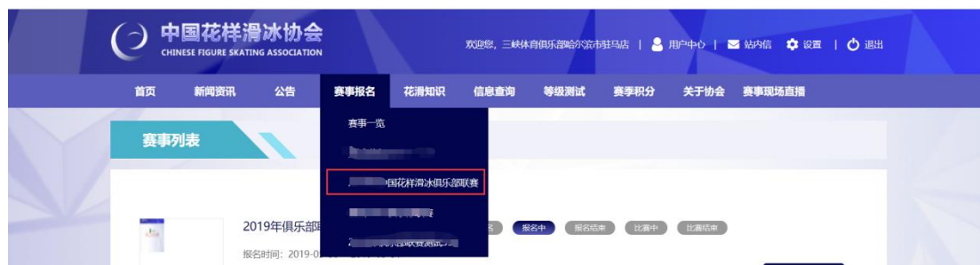
图3 导航栏进入赛事报名

点击导航栏“赛事报名”，选择要报名的赛事，点击该赛事进入报名；或可选择“赛事报名”子菜单中的“赛事一览”，选择对应的赛事，点击“报名入口”，进入报名。