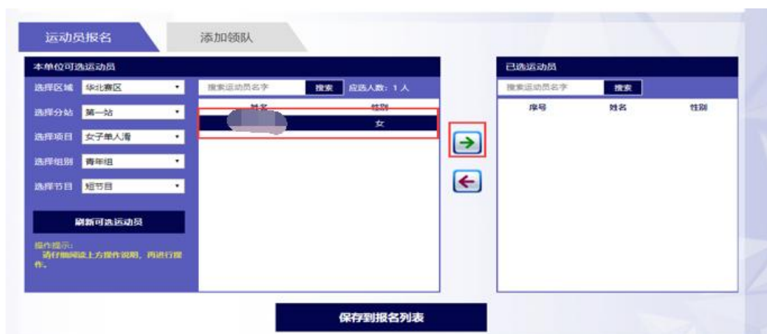
图 7 选择运动员

点击要报名的运动员，点击向右箭头，该运动员将进入已选运动员栏；如需调整，点击右侧已选栏中的运动员，点击向左按钮将其移出已选列表。确认报名人员后点击“保存到报名表”。