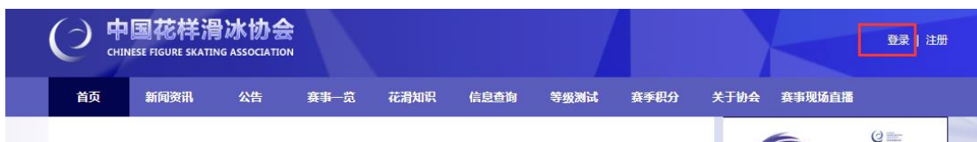
图 1 点击“登录”(红框所示位置)

访问中国花样滑冰协会官网(建议使用谷歌浏览器), 右上角点击“登录”, 登录俱乐部账号。如忘记密码, 提交找回密码书面申请发至 jlbls@cfsa.com.cn 。